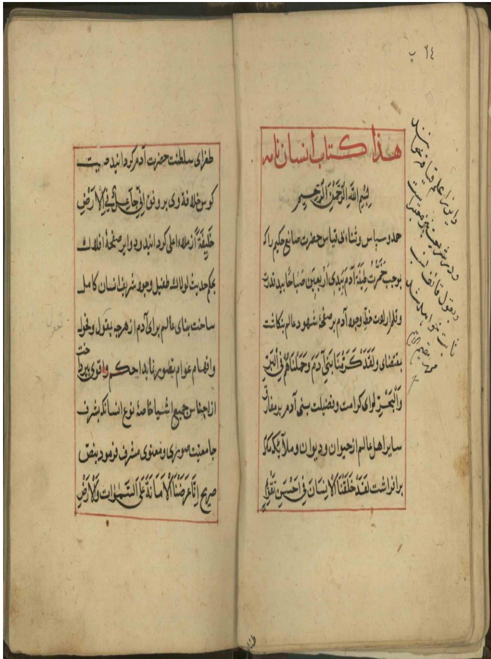
برگ اول نسخه شماره ۴۷۶۴/۲ کتابخانه مجلس شورای اسلامی